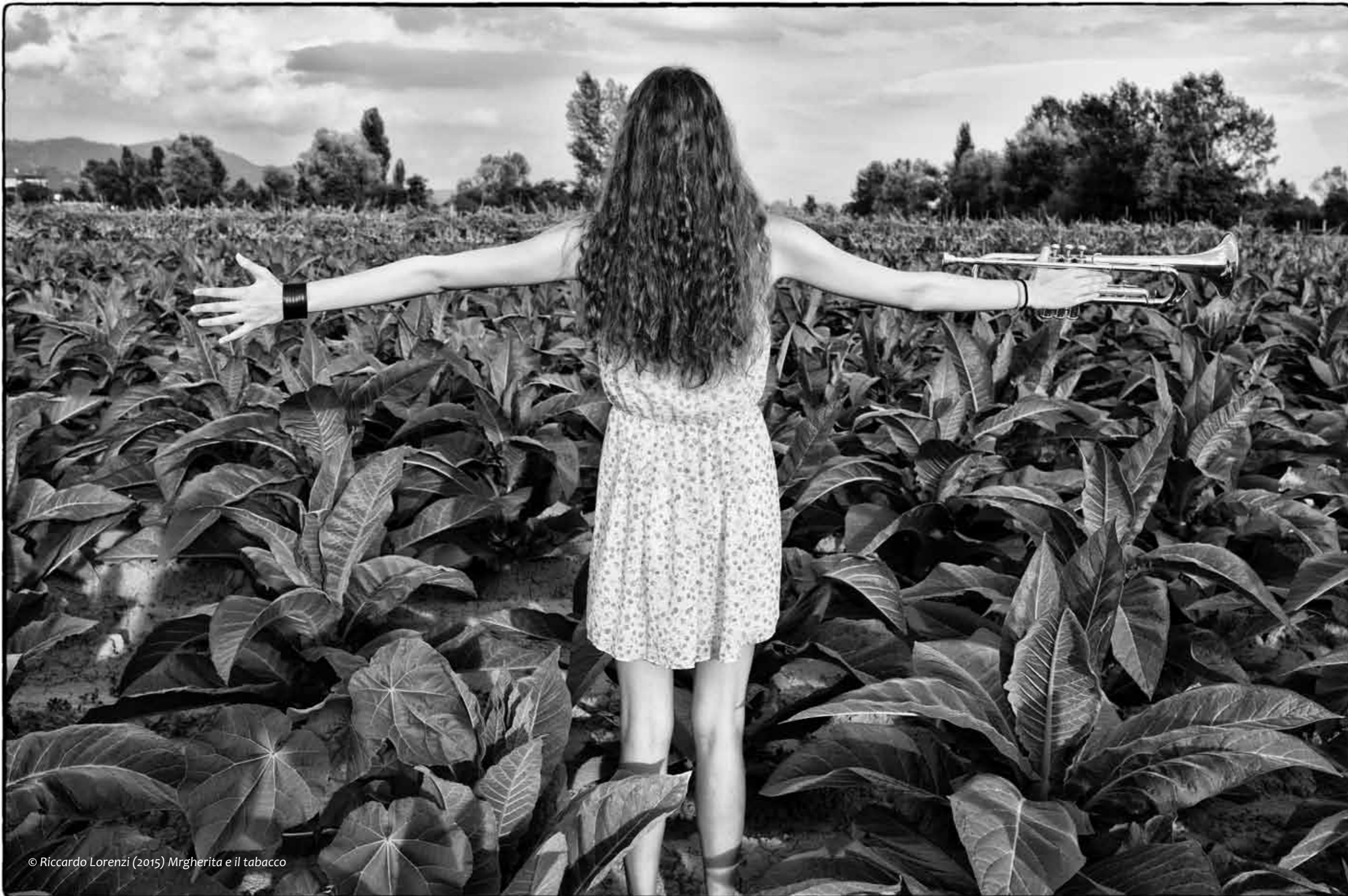
Mrgherita e il tabacco

“Il vaso dona una forma al vuoto e la musica al silenzio” Georges Braque, pittore e scultore