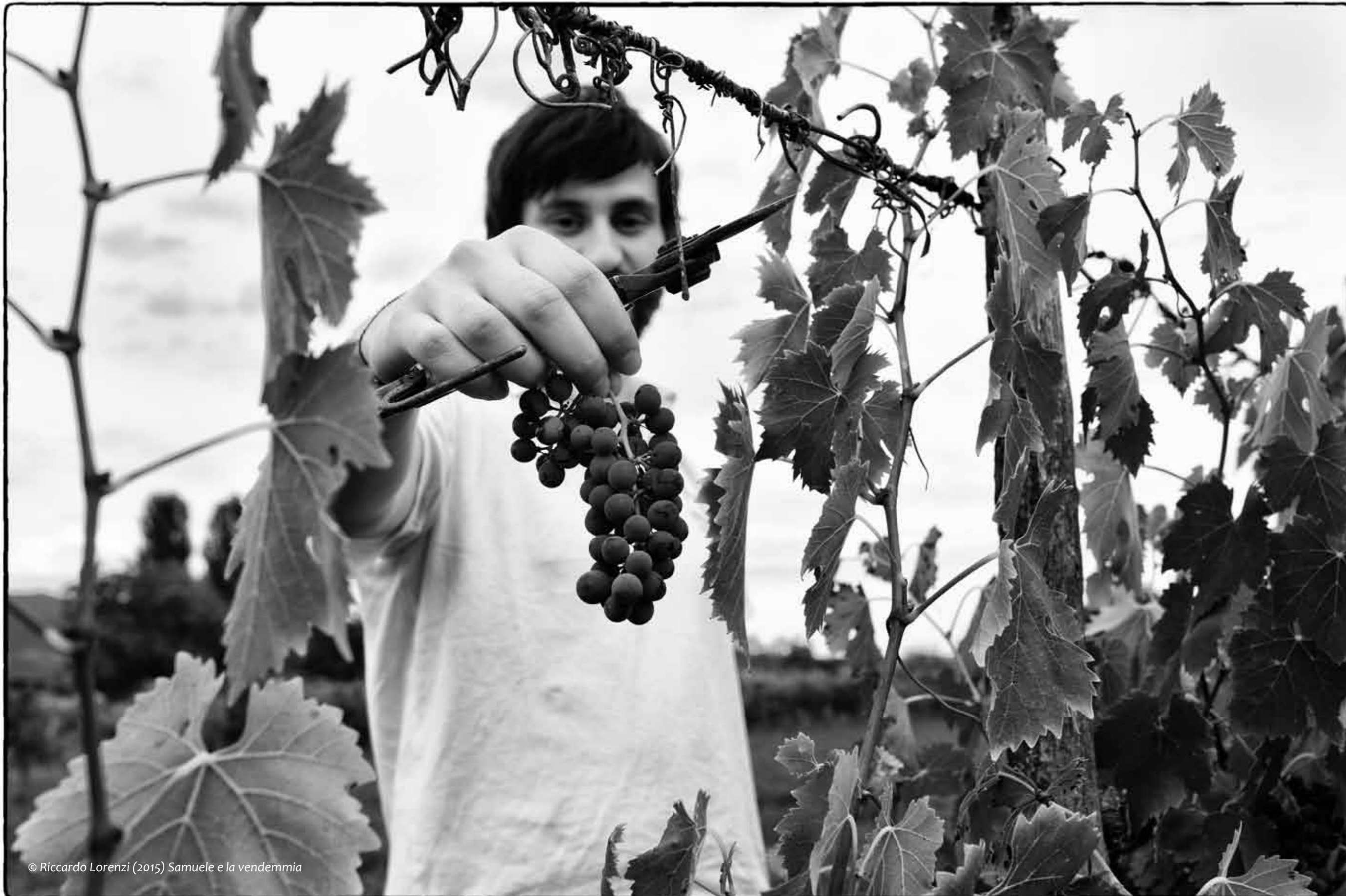
Samuele e la vendemmia

62 capi religiosi rappresentanti le più grandi religioni del mondo, si ritrovano ad Assisi, la città di San Francesco, per pregare per la pace.