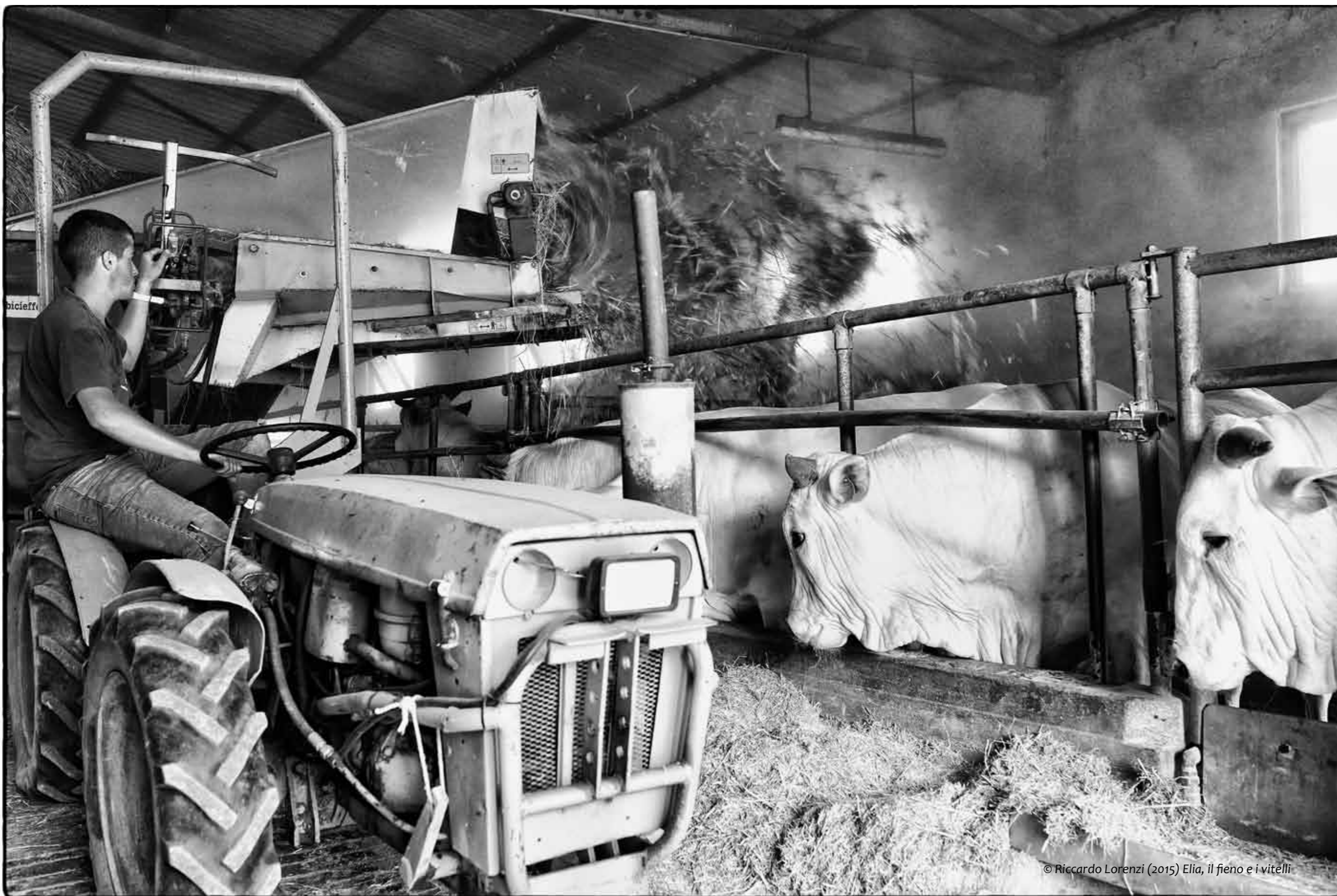
© Riccardo Lorenzi (2015) Elia, il fieno e i vitelli

"Mangiare non è assorbire una massa inerte di materia, ma anche e soprattutto, alla lunga, introdurre in sé i caratteri fondamentali degli esseri viventi da cui è stata presa" Lanza del Vasto, filosofo e poeta