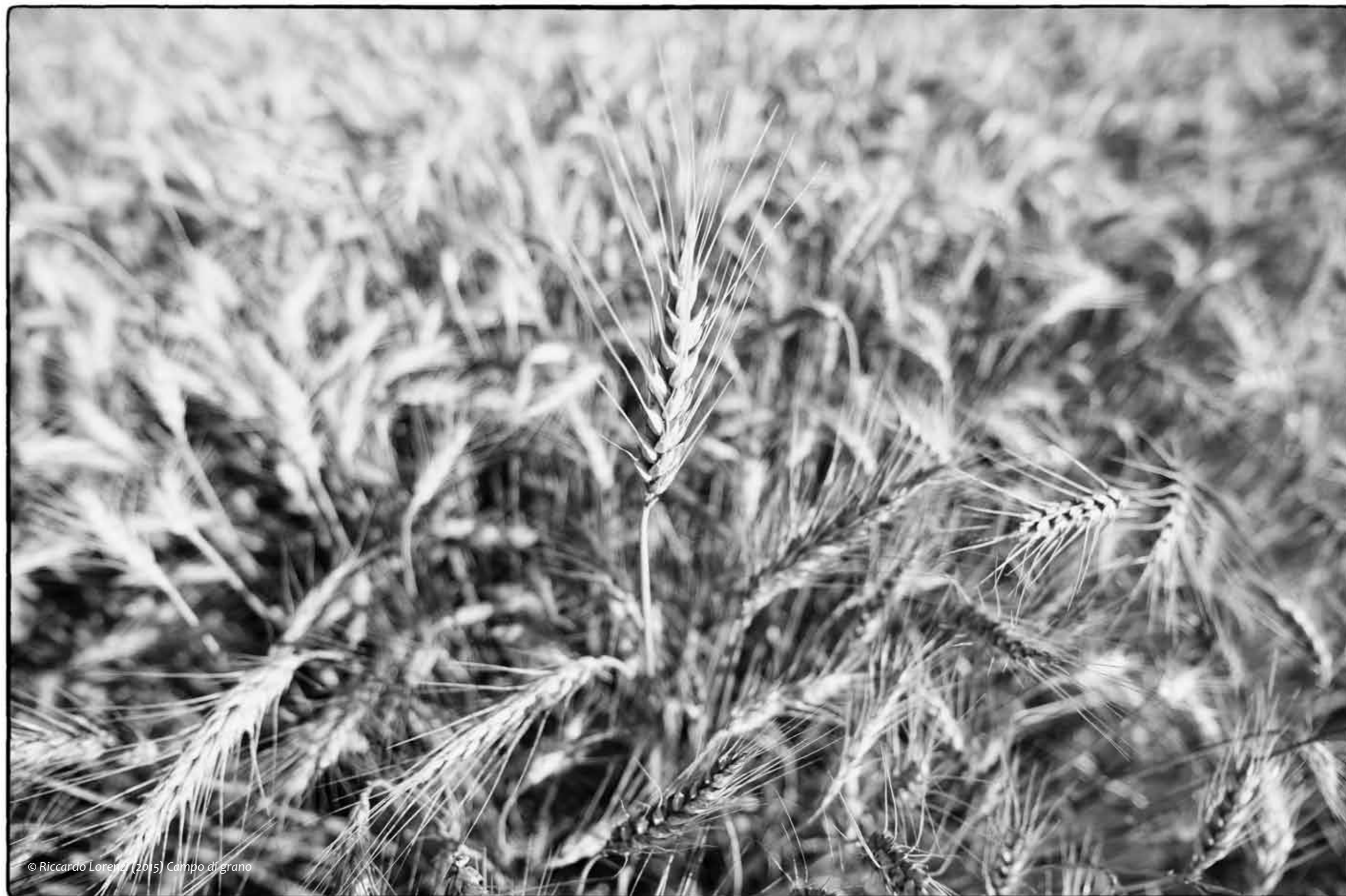
Campo di grano

Un milione di persone, disarmate, bloccano, nelle Filippine, i carri armati del dittatore Marcos costringendolo alla fuga