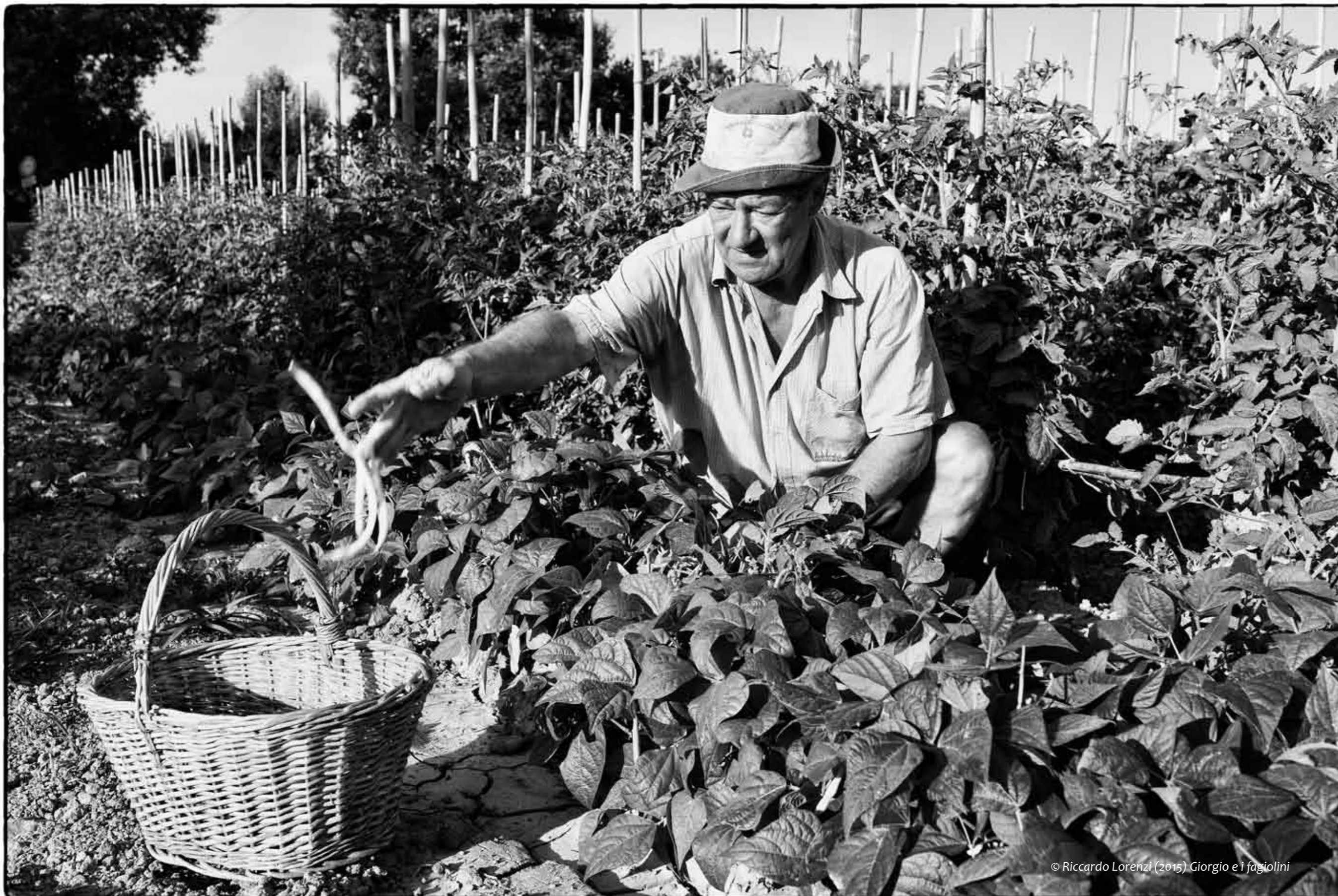
Giorgio e i fagiolini

“La struttura economica del mondo dovrebbe essere tale da non permettere che nessuno soffra per mancanza di cibo” Gandhi