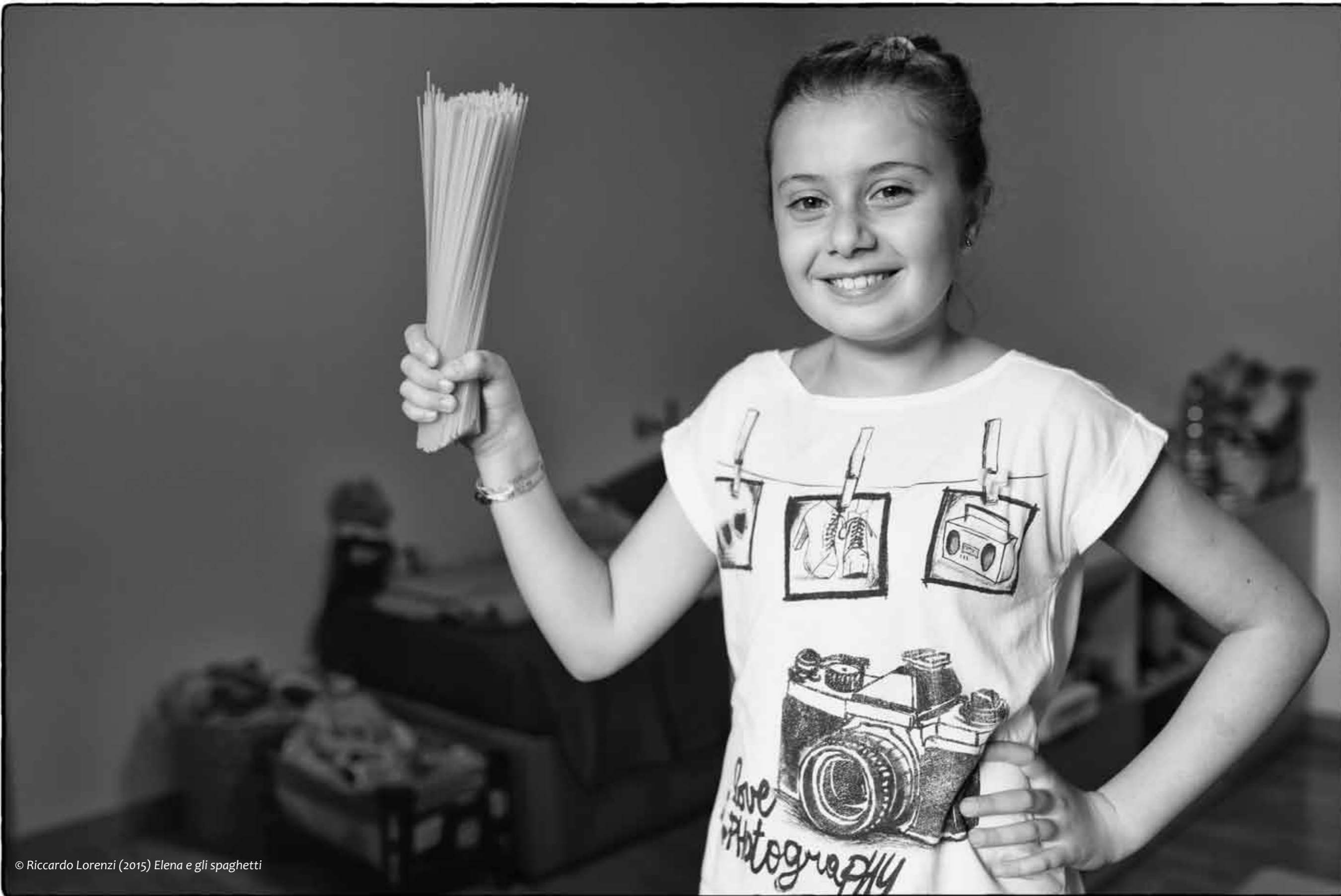
© Riccardo Lorenzi (2015) Elena e gli spaghetti

Giornata internazionale per l'educazione alla nonviolenza