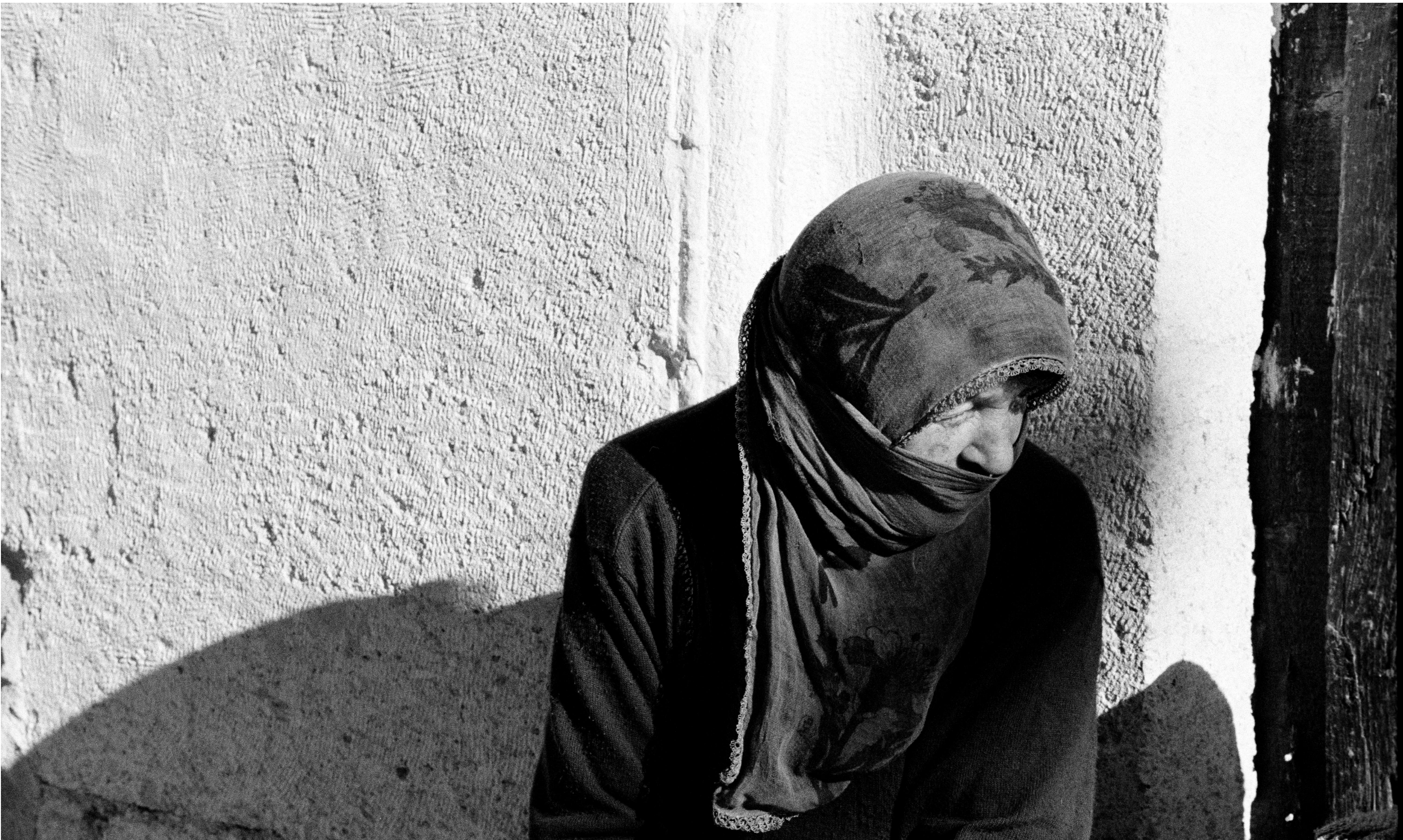
Riccardo Lorenzi ©